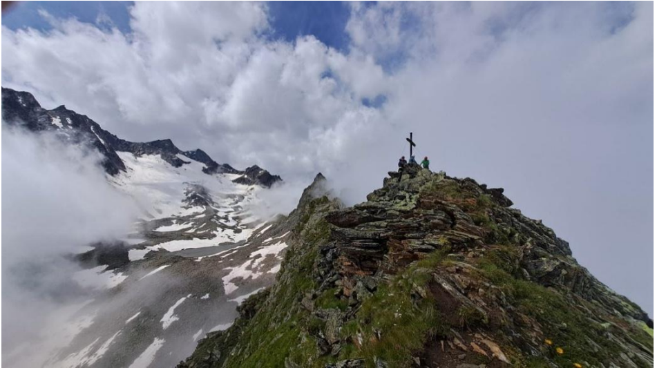
Ausbildungstour – Bild: Andreas Gauerhof